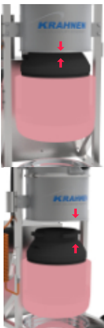
Einfachste Entnahme der Endlospack Patrone