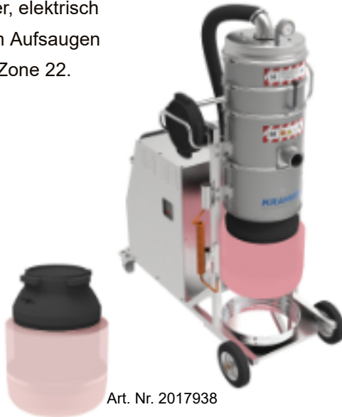
Art. Nr. 2017938