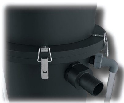
Ansaugreduzierung aus PE am Sauger montiert